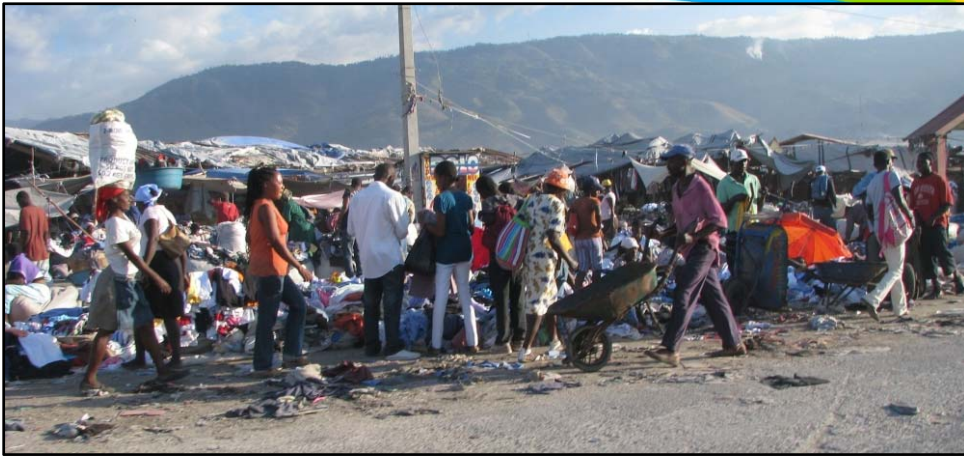
Eine typische Marktszene in der Nähe des Hafens von Port-au-Prince