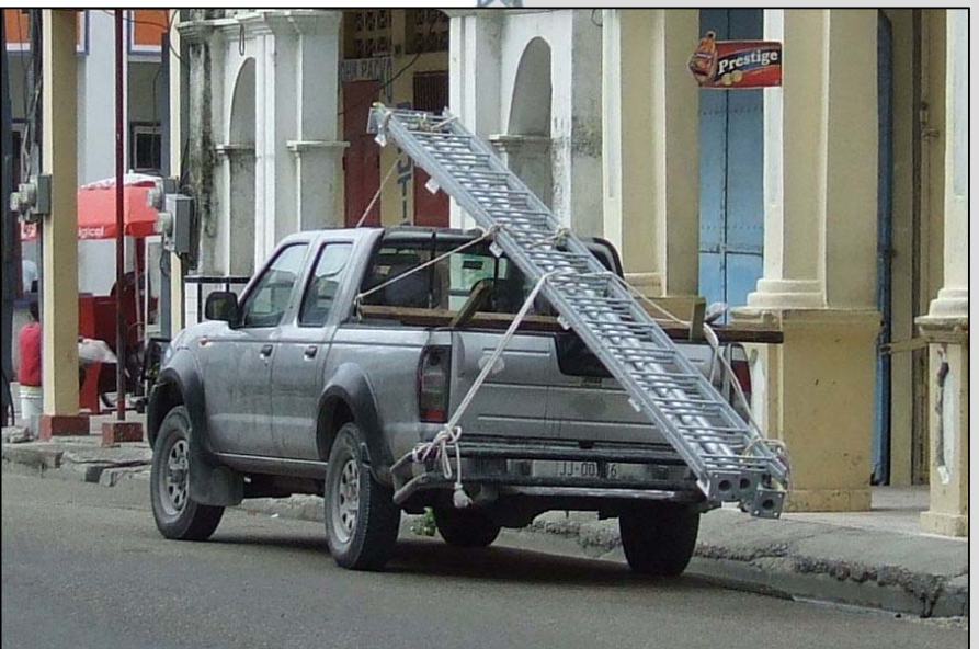
Der alte Nissan-Pickup mit Mastelementen im Jahr 2015

Dieser Jesus, der von euch weg in den Himmel aufgenommen worden ist, wird in derselben Weise wiederkommen, wie ihr ihn habt in den Himmel auffahren sehen! Apostelgeschichte 1, 11